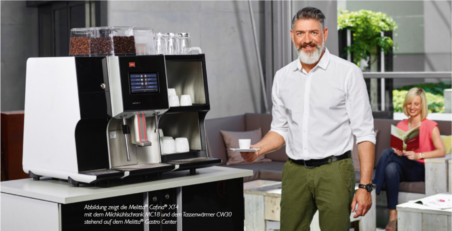
Abbildung zeigt die Melitta® Cafina® XT4 mit dem Milchkühlschrank MC18 und dem Tassenwärmer CW30 stehend auf dem Melitta® Gastro Center