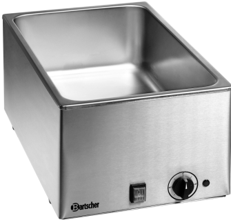
200.230 1 x 1/1 GN