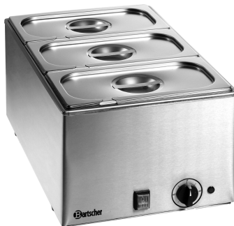
200.233 3 x 1/3 GN