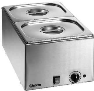
200.232 2 x 1/2 GN